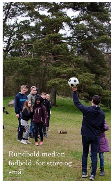
Rundbold med en fodbold for store og små!

Vi havde lejet en stor spejderhytte, Hylkedalslejren ved Gelsted, med masser af udenomsplads til aktiviteter for de, der ikke var blevet trætte efter o-løbet.