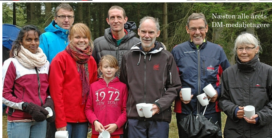
Næsten alle årets DM-medaljetagere