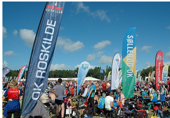
OK Roskildes nye fane blandt hundredvis af faner til O-ringen