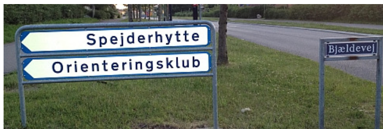
2012 Kommunen forærer OKR et vejskilt på Bjældevej