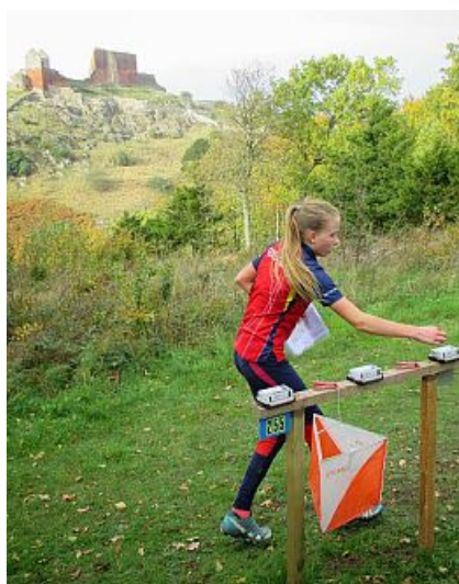
Karoline klipper posten med Hammerhus i baggrunden.

Sidste weekend i oktober deltog 37 løbere fra OK Roskilde i årets Høst-Open på Bornholm - et 2-dages internationalt o-stævne.