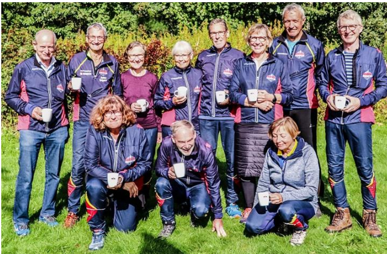
Alle årets DM medaljetagere fotograferet ved årets sidste divisionsmatch

2018: 26 medaljer (11 – 6 – 9) 2017: 15 medaljer (8 – 3 – 4) 2016: 12 medaljer (5 – 2 – 5) 2015: 22 medaljer (6 - 9 - 7) 2014: 23 medaljer (10 - 7 - 6) 2013: 18 medaljer (6 – 5 – 7) 2012: 12 medaljer (4 – 7 – 1) 2011: 13 medaljer (5 – 3 – 5) 2010: 12 medaljer (4 – 5 – 3) 2009: 15 medaljer (4 – 4 – 7)