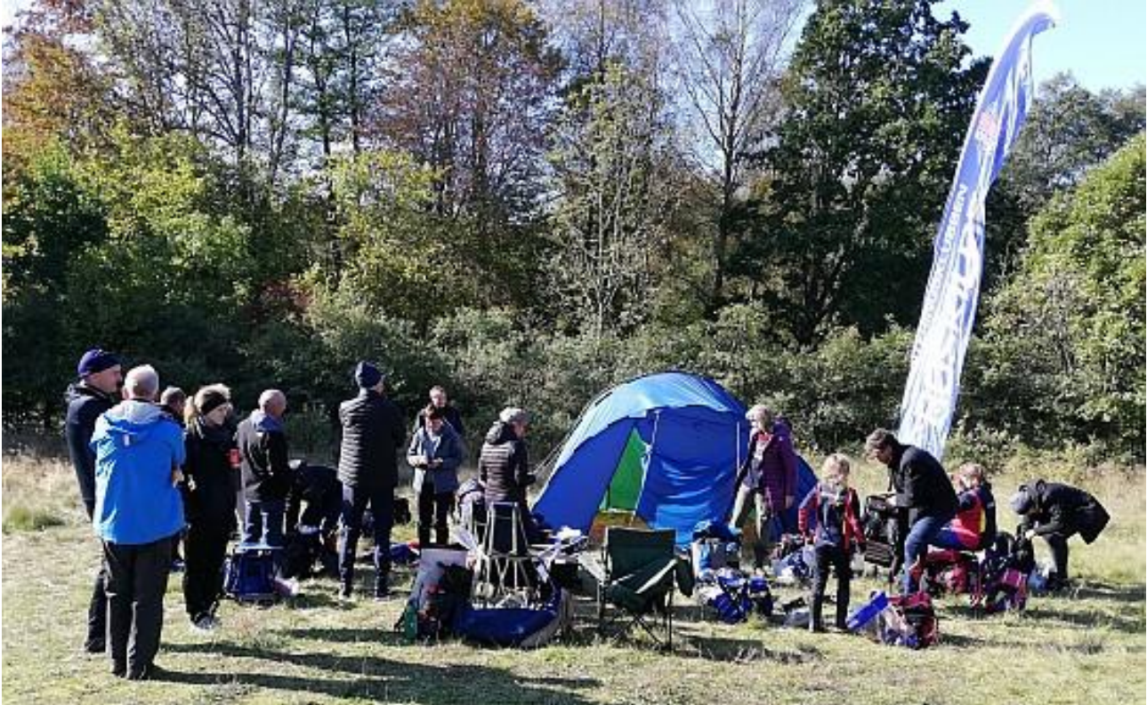
Fra klubturen til Blekinge