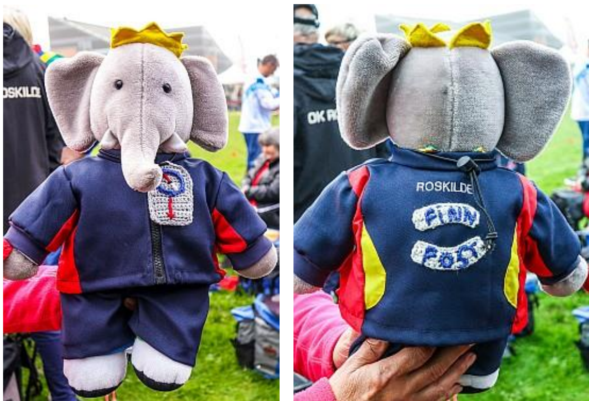
Klubmaskotten fik ny klubdragt, kompas og rygmærke i årets løb

Klubbens medlemmer foretog 1046 starter i danske løb med tilmelding gennem O-service i 2019 (2018: 1035), det vidner sammen med starter i en del udenlandske løb om et relativt højt aktivitetsniveau i skoven blandt medlemmerne, idet OK Roskildes 147 aktive medlemmer udgør godt 2,3 % af DO-F's 6397 aktive medlemmer, men tegner sig for 2,9% af samtlige 35604 starter.