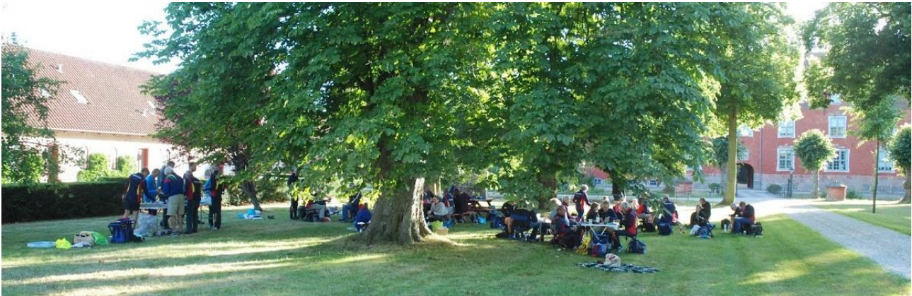
Stemmingsbillede fra Sankt Hans løbet

Roskilde 3-dages blev afholdt i Pedersted, Avnstrup og Eriksholm.