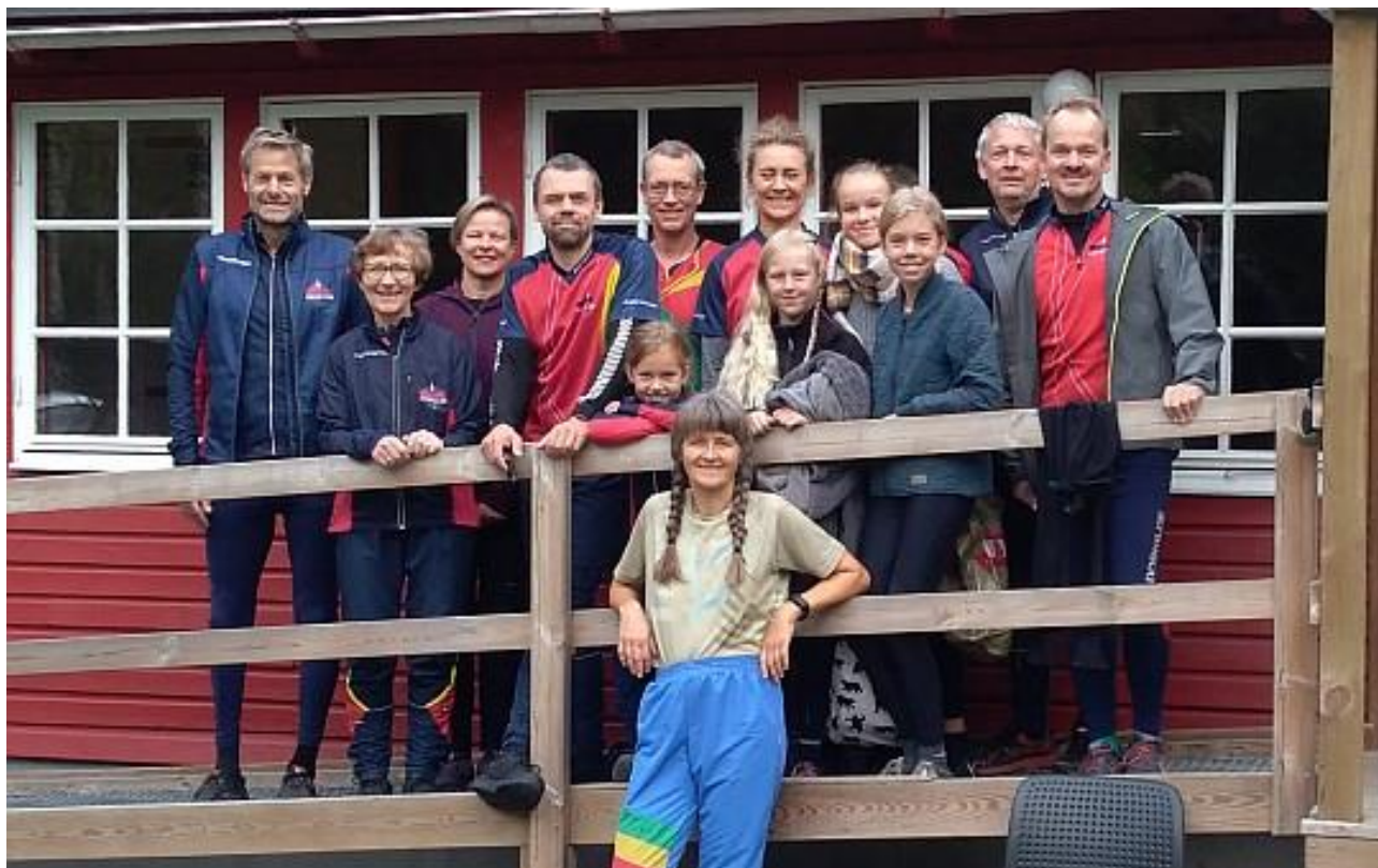
Fra klubturen til Sverige

Klubben har i årets løb haft fælles ture til Påskeløbet på Fanø og DM'erne. Desuden var der klubbetur til Hallandsåsen i oktober.