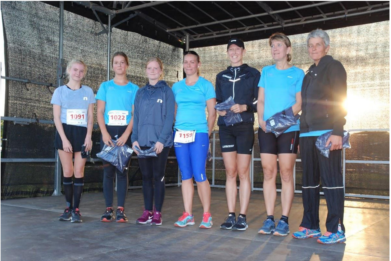
Vinderne af SMUK kvindeløb 2018.

Omkring 430 elever fra 4., 5. og 6. klasse fra en række skoler i Roskilde og omegn deltog tirsdag i Skolernes Find vej Dag i Folkeparken. Det er 8. år OK Roskilde afholder dette arrangement, der med John Blaase som primus motor afvikles af en række af Roskildes Grå Pantere.